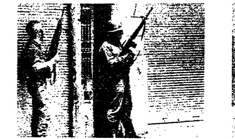
شريطان في حالة تاهب بالكرنيتا

قتلت سيارة «فولسفاك» سوداء رقمها ٢٩٦٦٦ موديل ١٩٦٢ لصاحبها سلاح البعلمة، بالقرب من يعرف عنها شيئاً الاتصال بالهاتف ٢١٥٢٨.